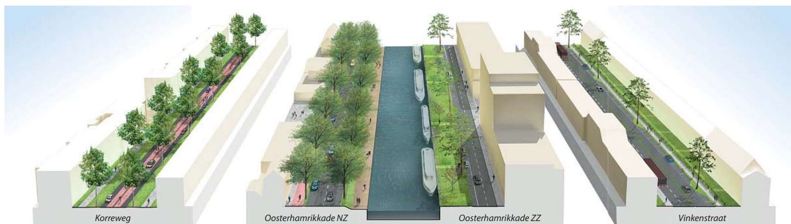
Een van de twaalf tekeningen die van de Oosterhamrikzone zijn bedacht met autoverkeer op de Oosterhamrikkade (midden), fietsers en een enkele auto op de Korreweg (links) en bussen in de Vinkenstraat (rechts).